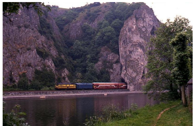
Train de voyageurs sur la ligne 154 à Waulsort, 27 mai 1989 (Réf. M254_020)

La section entre Namur et Dinant échappe à cette fermeture. En 1981, il est même décidé d'électrifier cette section. Les travaux débutent en 1984 et il faudra attendre le 27 mai 1990 pour la mise en service de la traction électrique.