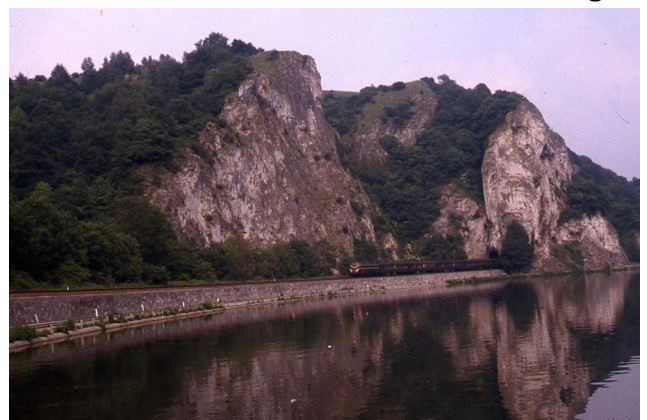
Train de voyageurs sur la ligne 154 à Neffe, 7 juillet 1982 (Réf. M272_011)

La ligne 154 suit de près les méandres de la Meuse et les quelques 50 km de ligne offrent des débouchés aux carrières, aux produits houillers et métallurgiques de la vallée de la Meuse vers le Nord et l'est de la France. Un trafic considérable de marchandises en provenance du bassin liégeois et de la France ne va pas tarder à se développer sur cet axe, à caractère international.