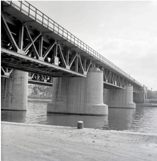
Pont de Luxembourg à Namur (Réf. Z04720a)

La Première Guerre mondiale va perturber le trafic sur la ligne et, en 1915, les Allemands entament la mise à double voie de l'ensemble de la ligne pour des raisons stratégiques en vue de ravitailler le front de Champagne. L'entre-deux guerres verra l'essor des trains à vocation touristique. Les « trains de plaisir » mis en service dans les années 1930, dans la foulée des congés payés emmènent les vacanciers vers les Ardennes belges.