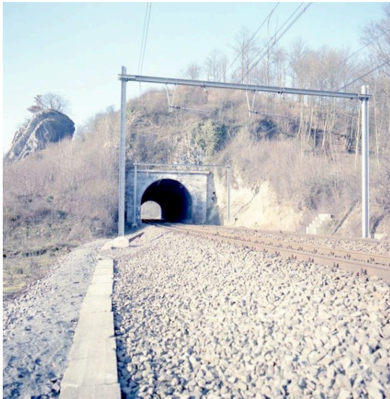
Tunnel de Godinne, février 1989 (Réf. K00867)

La construction de la ligne Namur – Dinant – Givet est étroitement liée à la Société anonyme des chemins de fer de Namur à Liège avec ses extensions , compagnie britannique ayant obtenu en 1845 la concession pour les lignes ferroviaires de Namur à Liège. Cette concession cèdera son bail à la Compagnie du Nord-Belge en 1855.